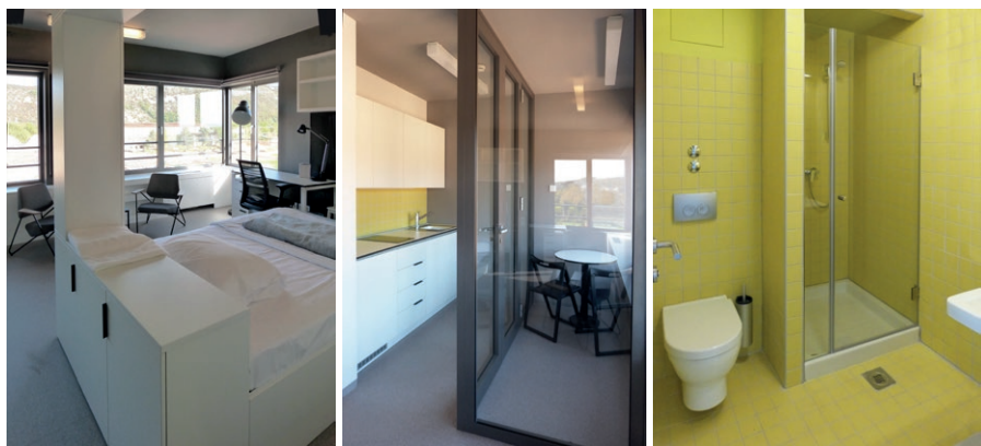
sl. 13.-16. - primjer apartmana za profesore