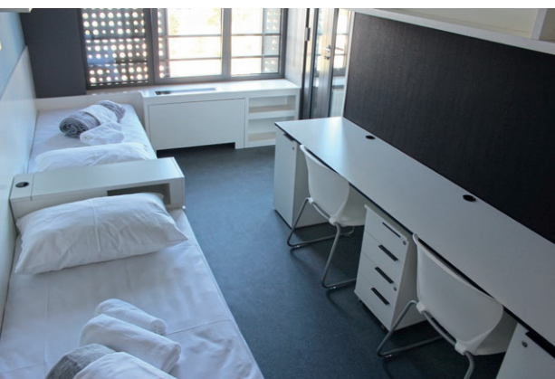
sl. 9.-12. - primjer dvokrevetne sobe